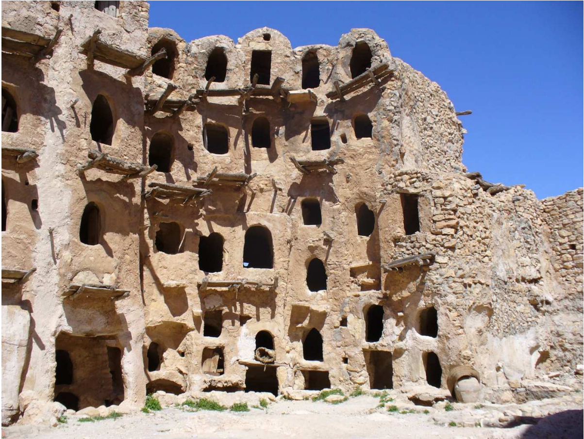
Eine gestaltete Heimat mit immobilem Besitz erweckt Begehrlichkeiten. Innenbereich einer wehrhaften Speicherburg in der Sahara.

In diesem Zusammenhang können wir uns auch nicht einer weiteren Erkenntnis verschließen, nämlich dass neben individuellem auch soziokultureller gemeinschaftlicher Besitz, auch Land, welches die Lebensgrundlagen zuverlässig sichert oder es erlaubt, Handelswege zu kontrollieren, schon immer Begehrlichkeiten erweckte. Auf schierer Macht begründet, etablierten sich „Landesherrn“, denen das Volk zu dienen hatte. Solche Mächtigen konnten und mussten freilich auch die Abwehr gegen fremde Mächte organisieren.