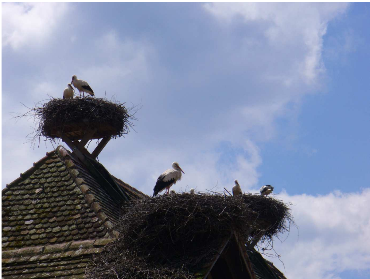
Die historisch und emotional uns Menschen besonders verbundenen Störche suchen immer wieder ihr Heimatnest auf, obgleich sie tausende Kilometer entfernt überwintern.

Würde ein Mensch so beharrlich einem bestimmten Ort zustreben, hieße das Sehnsucht. Warum nur beim Menschen? Weil der Verstand hat? Mit Verstand hat dieses diffuse Gefühl ja gerade nichts zu tun. Mit dieser Feststellung will ich Heimatgefühle nicht abwerten, sondern im Gegenteil, betonen, wie tief verwurzelt sie sind – nicht nur bei Meeresschildkröten.